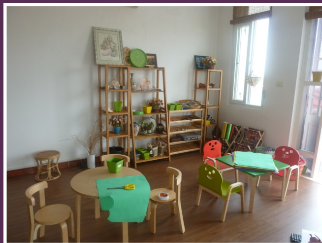
Green Pine Clinic

Experienced nursing volunteers will enjoy working with WECARE – a professional home nursing service provider. WECARE features in providing nursing and care for the end-life patients of two main categories: the elderly, people with cancer and other serious illnesses sufferers. Your experience in nursing and health care will bring a higher standard to the service and its patients through conducting and upgrading trainings about nursing skills as well as following the post-training practices of the nurses.