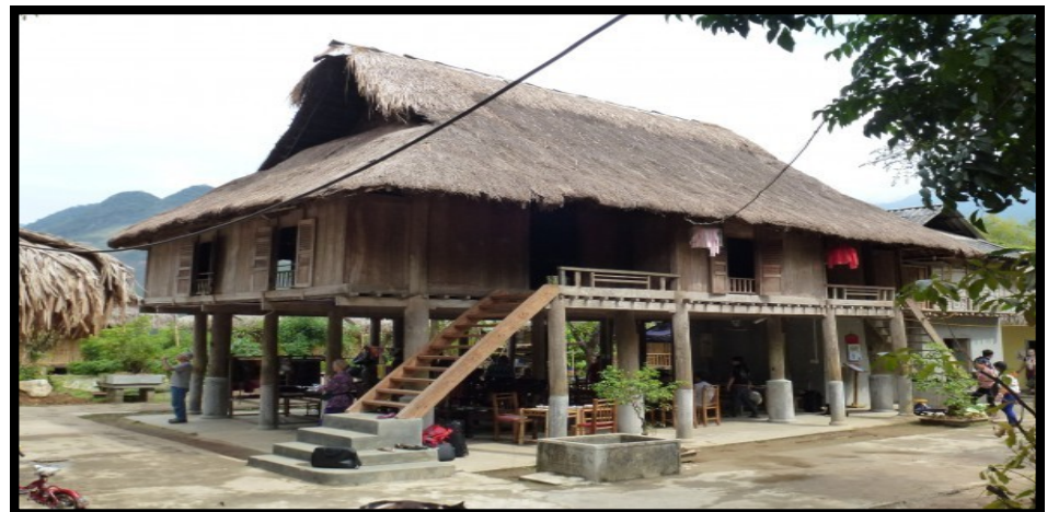
Een foto van de 'natural lodge' waar ik een kamer had geboekt

Het is vandaag 11 maart 2013 en de eerste werkdag zit er alweer op. Vandaag heb ik uren lang de website van SCDI zitten te bestuderen. Ze willen de website meer extern gericht maken en waren benieuwd hoe ik er tegen aankijk. Kritiek geven in een organisatie die drie jaar oud is, vraagt voorzichtigheid. Zeker in Vietnam waar minder direct gecommuniceerd wordt. Toch blijkt het goed te zijn om open te zijn want ze ervaren mijn kritiek als 'fair'. Ik benadruk dat het hun proces is en het aan hun is wat ze met mijn opmerkingen doen. Dus mijn reactie werd op papier gezet en komende vrijdag ga ik dit bespreken met de medewerker communicatie.